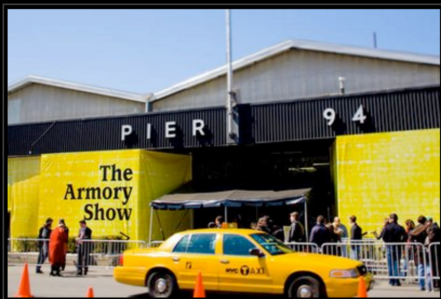
Armory Show, 2009

Par ailleurs, les collectionneurs se font moins nombreux et prennent beaucoup plus de temps pour se décider à acheter même sur une œuvre abordable d'un artiste émergent. On ressent moins cette course frénétique à l'achat qui caractérisait le monde de l'art ces dernières années. Il y a 5 ans, ces foires satellites autour de l'Armory Show n'existaient pas, les ventes se faisaient beaucoup plus vite, les jeunes collectionneurs étaient pour beaucoup très impulsifs. Aujourd'hui, ils prennent le temps de réfléchir à ce qu'ils veulent acheter, ce qui n'est pas plus mal quand on voit que la côte de certains artistes inconnus a complètement explosé ces dernières années sans aucune raison valable. On vit un moment important, nous sommes en train d'assister à un ajustement, pas seulement dans le système financier, mais aussi dans le monde de l'art.